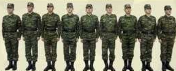
РАЗВЁРНУТЫЙ СТРОЙ ОТДЕЛЕНИЯ — ОДНОШЕРЕНОЖНЫЙ