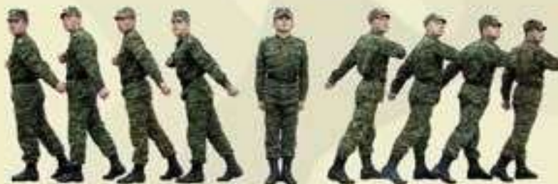
РАЗМЫКАНИЕ ОТДЕЛЕНИЯ НА МЕСТЕ