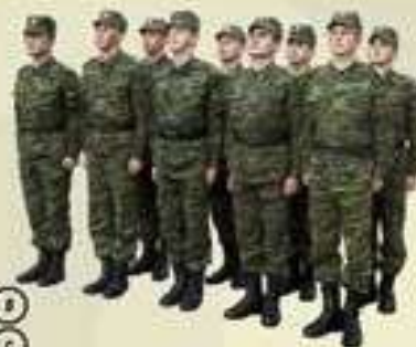
РАЗВЁРНУТЫЙ СТРОЙ ОТДЕЛЕНИЯ — ДВУХШЕРЕНОЖНЫЙ