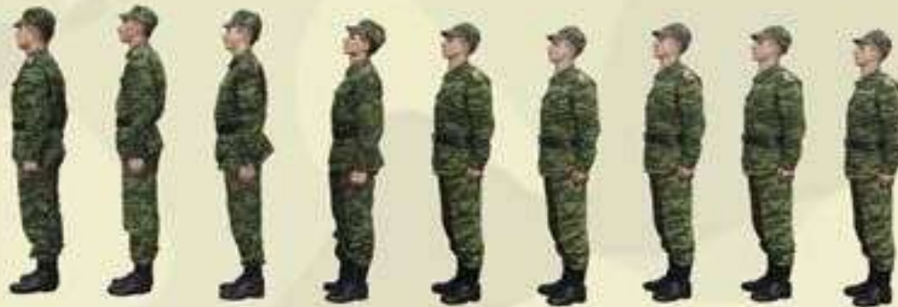
ПОХОДНЫЙ СТРОЙ ОТДЕЛЕНИЯ — В КОЛОННУ ПО ОДНОМУ

Походный строй отделения может быть в колонну по одному или в колонну по два. Построение отделения производится по команде "Отделение, в колонну по одному (по два) — СТАНОВИСЬ". Отделение численностью четыре человека и менее строится в колонну по одному