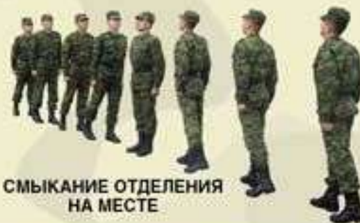
СМЫКАНИЕ ОТДЕЛЕНИЯ НА МЕСТЕ