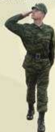
ВЫПОЛНЕНИЕ ВОИНСКОГО ПРИВЕТСТВИЯ НА МЕСТЕ